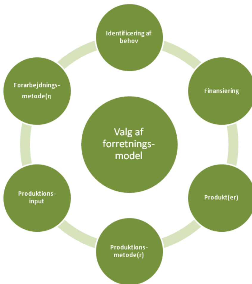
Figur 2. Faktorer i valg af forretningsmodel for algeproduktion til energiformål